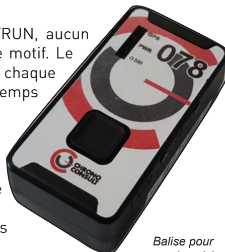
Balise pour le suivi

Les participants ainsi retenus, devront valider leur engagement en s'enregistrant sur la plateforme internet NEXTRUN à partir de début Décembre 2022.